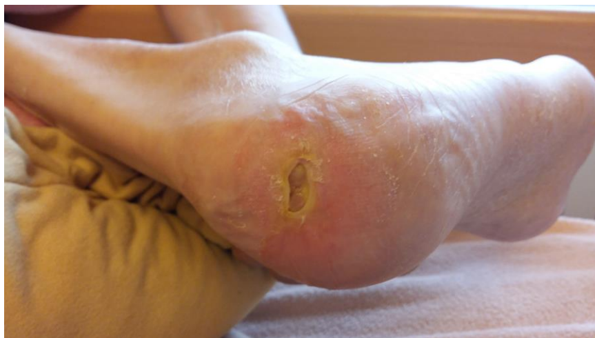
Foto-4b: powiększenie - odleżyna po 6 tyg. stosowania Tubulex, widoczny nowy narastający do środka rany naskórek (koloru żółtego), - na dnie rany po ziarninie - narasta nowy naskórek, spłycając dno odleżyny.

Foto-4a: odleżyna po 6 tyg. stosowania Tubulex.