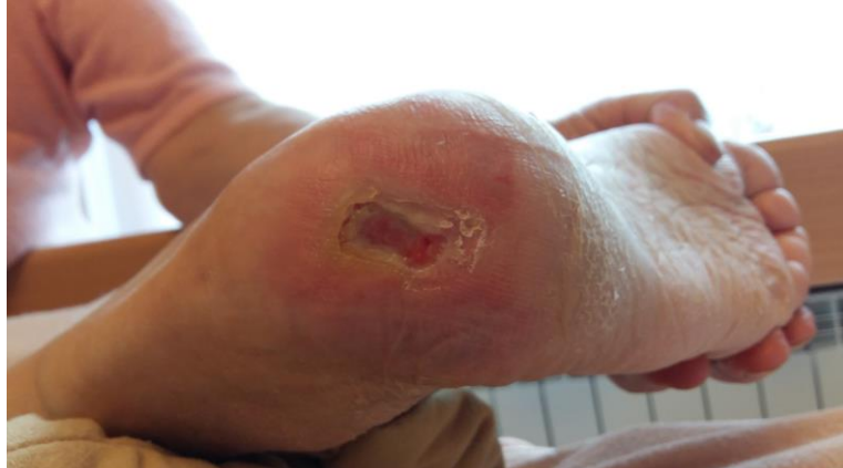
Foto-1b: powiększenie - na całym obwodzie odleżyny widoczny młody narastający do środka naskórek...

Foto-1a: odleżyna w okolicy pięty nogi prawej - w 2 tyg. po rozpoczęciu stosowania tamp. Tubulex,