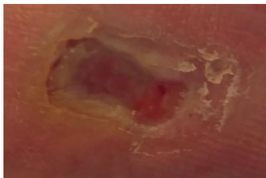
Foto-2a: odleżyna w okolicy pięty nogi prawej - po 4 tyg. stosowania Tubulex,