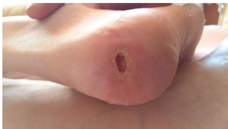
Foto-2b: powiększenie - wcześniej narastający młody naskórek - uległ dalszej regeneracji i zamienił się w skórę, - dno odleżyny pozostało tak samo głębokie - czyli bez zmian, - natomiast długość i szerokość odleżyny uległa zmniejszeniu...

Foto-2a: odleżyna w okolicy pięty nogi prawej - po 4 tyg. stosowania Tubulex,